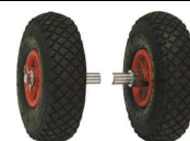
Ruote per trasporto Transport wheels