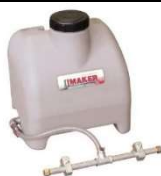
Kit impianto acqua Water system kit