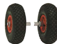
Ruote per trasporto Transport wheels

*La macchina è venduta completa di kit ruote per il trasporto, documentazione tecnica e certificato CE.